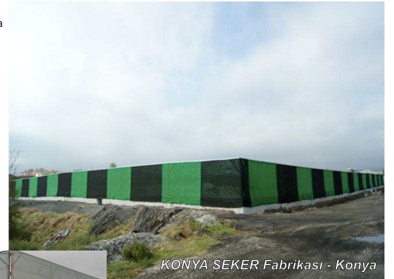
KONYA ŞEKER Fabrikası - Konya