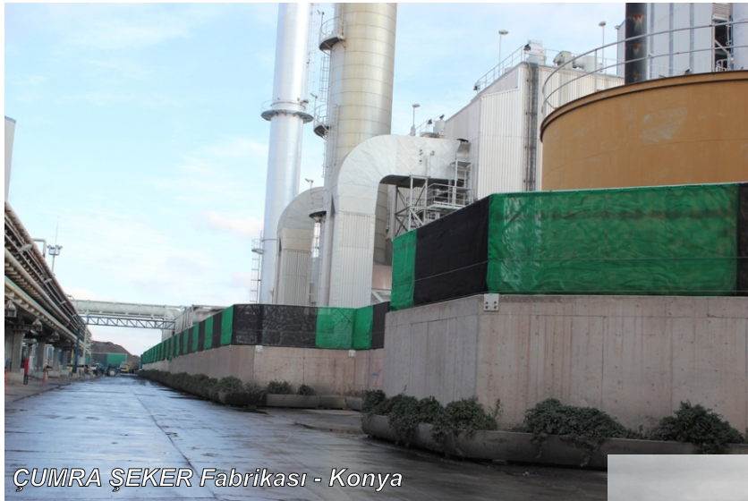
ÇUMRA ŞEKER Fabrikası - Konya