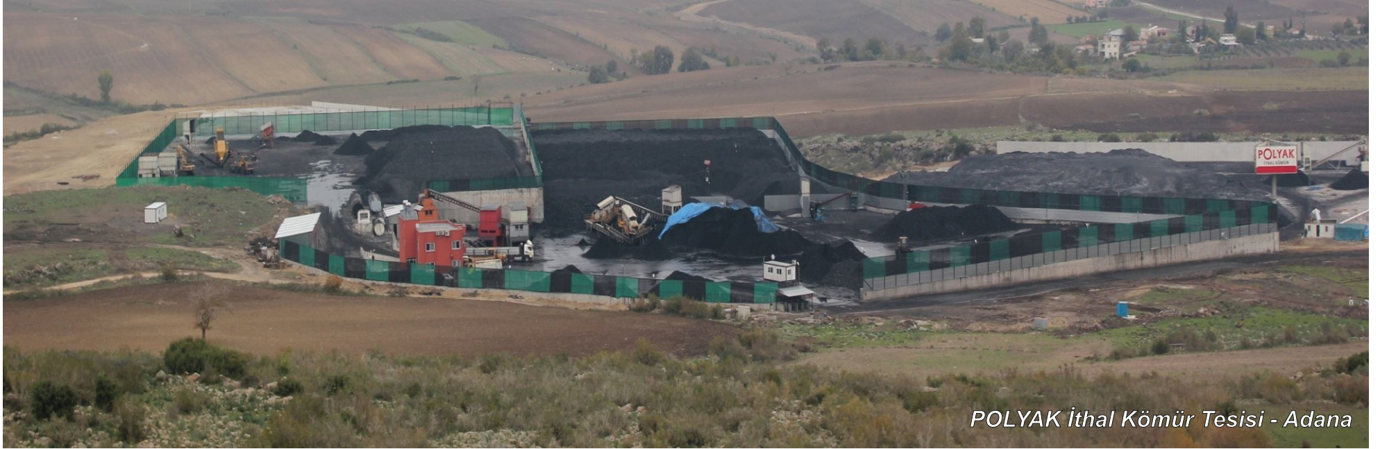
POLYAK İthal Kömür Tesisi - Adana