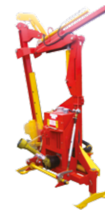
Wide stands Breite Stützen Pies laterales