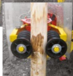
Mechanical or hydraulic (in option) post clamp. Mechanische oder Hydraulische Pfahlklemme mit Diabolo-Rollen. Abrazaderas mecánicas o hidráulicas (en opción)

To drive posts up to 3m length. Rammt Pfähle bis zu 3 m Länge ein. Para clavar postes de hasta 3 m.