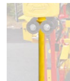
Metal bar for first hole Vorlochstange Barra de metal para el primer agujero