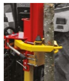
Post clamp kit with arms Gebogene Halteklemmen Kit de abrazaderas con brazos