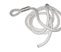
Polyamide rope, Ø 16, 3.20 m long Seil aus Polyamid Ø 16, 3.20 m Länge Cuerda de poliamida, Ø 16, 3.20 m de largo