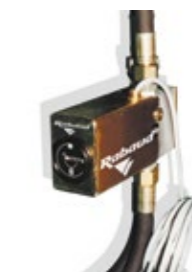
Electromechanical time meter Elektromechanischer Betriebsstundenzähler Contador de duración electromecánico