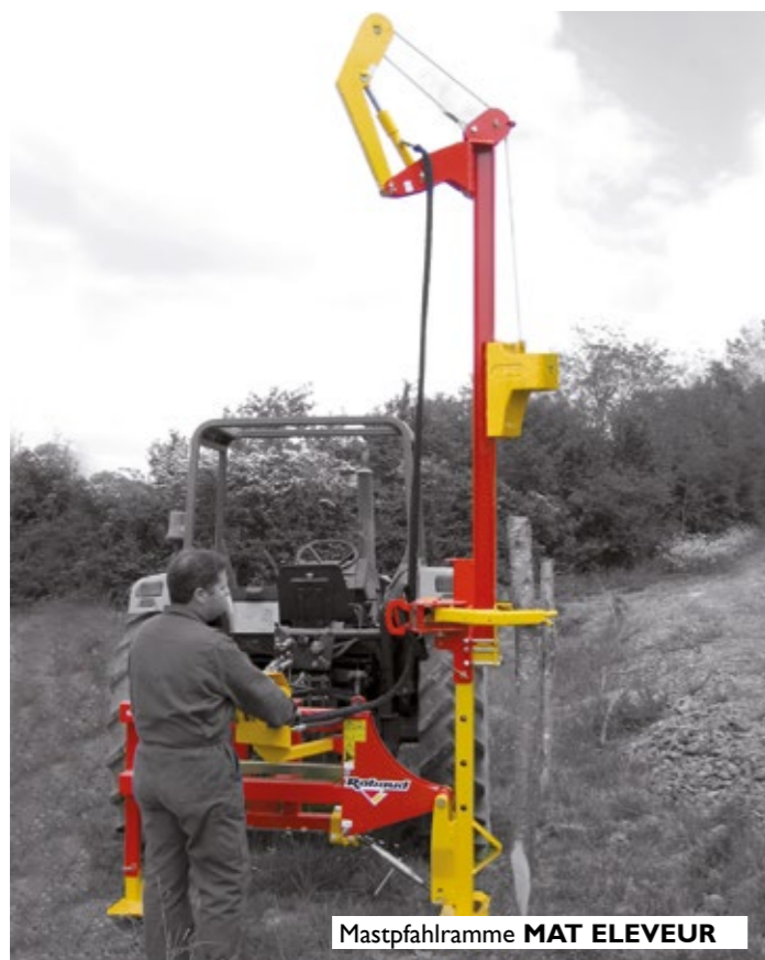
Mastpfahlramme MAT ELEVEUR