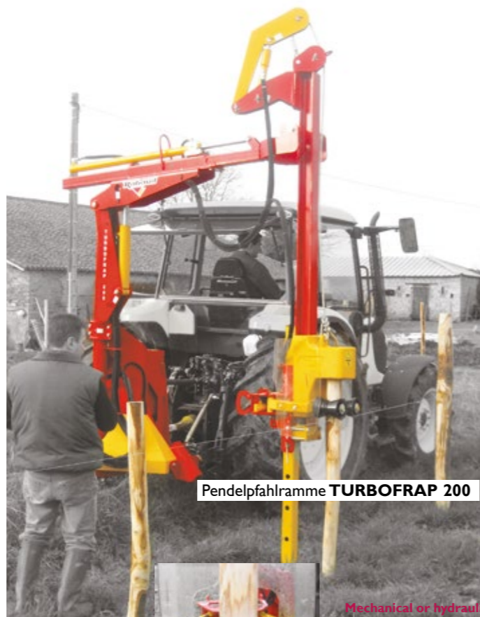
Pendelpfahlramme TURBOFRAP 200