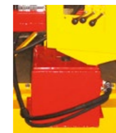
Hydraulic unit PTO 540 rpm, pump 15 L/min Hydraulikaggregat, Zapfwelle 540 U/min, Pumpe 15 L/min Unidad hidráulica PTO 540 rpm, bomba 15 L/min