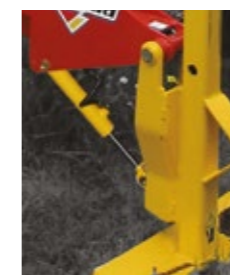
Hydraulic tilting in option Hydraulische Neigung als Option Inclinación hidráulica en opción