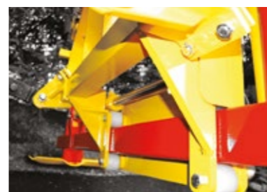
Hydraulic offset (50 cm) in option Hydraulischer Seitenversatz 50 cm als Option Desplazamiento hidráulico (50 cm en opción)