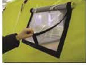
asetatlı ve sineklikli pencere (standart)