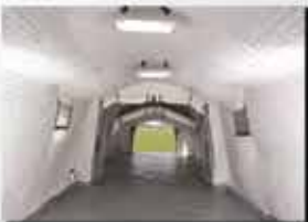
İzolasyon katmanı ve Aydınlatma Aparatları