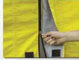
ticari fermuar (standart)