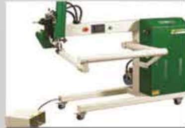
Sıcak Hava Kaynak Makinesi