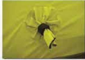
ısıtma kanalı (standart)