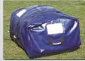
taşıma çantası (standart)