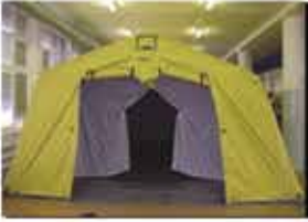
bölmeli odalar (isteğe bağlı)