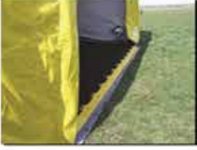
zemin kaplama (isteğe bağlı)