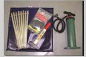
tamir takımı (standart)