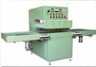
Yüksek Frekans Makinesi